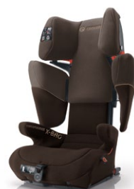
// DESIGN MOCCA