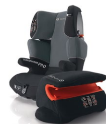
// DESIGN GRAPHITE