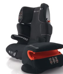
// DESIGN DARK NIGHT