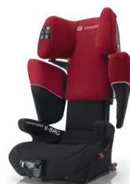
// DESIGN PEPPER