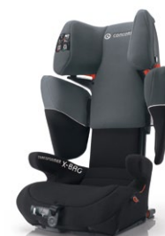
// DESIGN GRAPHITE