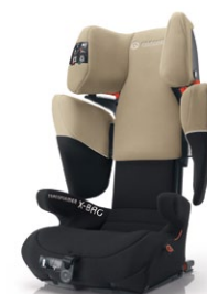
// DESIGN SAHARA