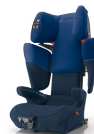
// DESIGN INDIGO