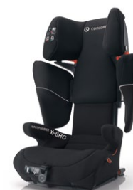
// DESIGN DARK NIGHT